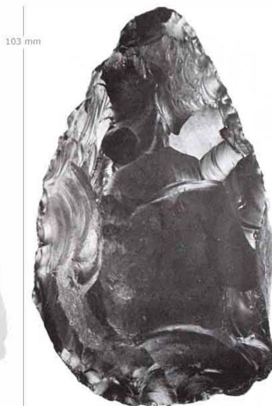
▲ Afb. 3 De vuistbijl van Elahuizen (Frl.) is gevonden door Hans van Gosliga, een oud-leerling van Jan Hagens.

Nee, ik vind het fantastisch om af en toe in de omgeving van het Zuidlimburgse Rijckholt en St. Geertruid te zoeken. Verder is Denemarken een geliefd oord. Natuurlijk passen in dit rijtje ook het Franse Le Grand Pressigny en de Dordogne. Gelukkig deelt mijn vrouw mijn interesse en verrast ze mij op onze archeologische vakantie-zwerftochten af en toe met een interessante vondst.