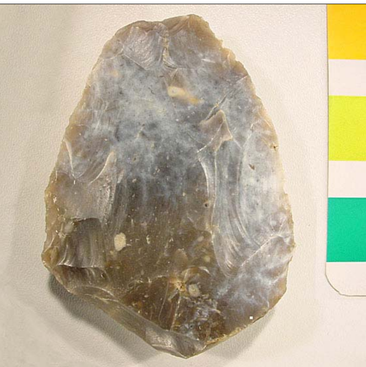
▲ Afb. 3

Johan ten Hoopen vond deze vuistbijl in het waterkanaal van de Molen van Bels. Op deze 8 cm lange bijl is ondermeer glanspatina en witte patina aanwezig. Windlak ontbreekt, een verschijnsel dat wel aanwezig is op de vuistbijl van Mander die ruim 1 km verderop gevonden is (zie afb. 4). Ondermeer door de afwezigheid van windlak concludeerde Dick Stapert dat het niet om een paleolithisch werktuig gaat, maar om een veel jonger neolithisch artefact.