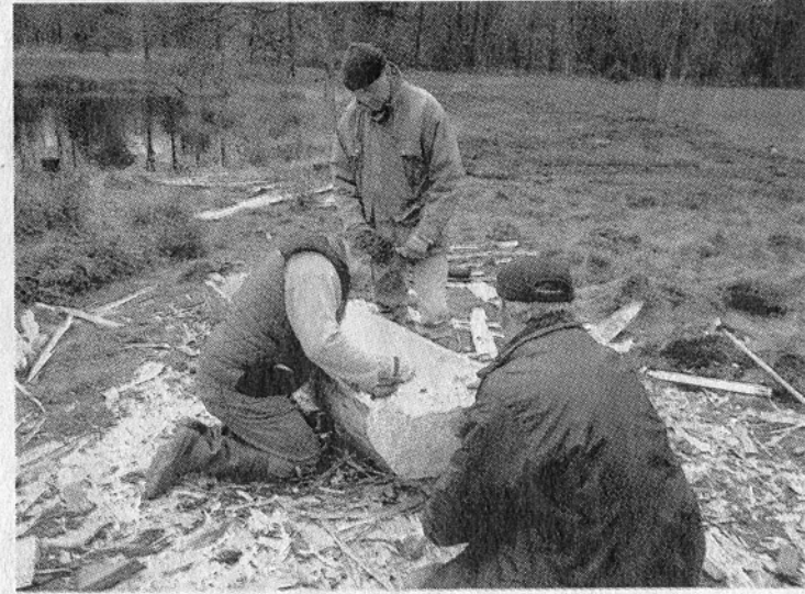
Langzaam maar zeker krijgt de replica vorm.